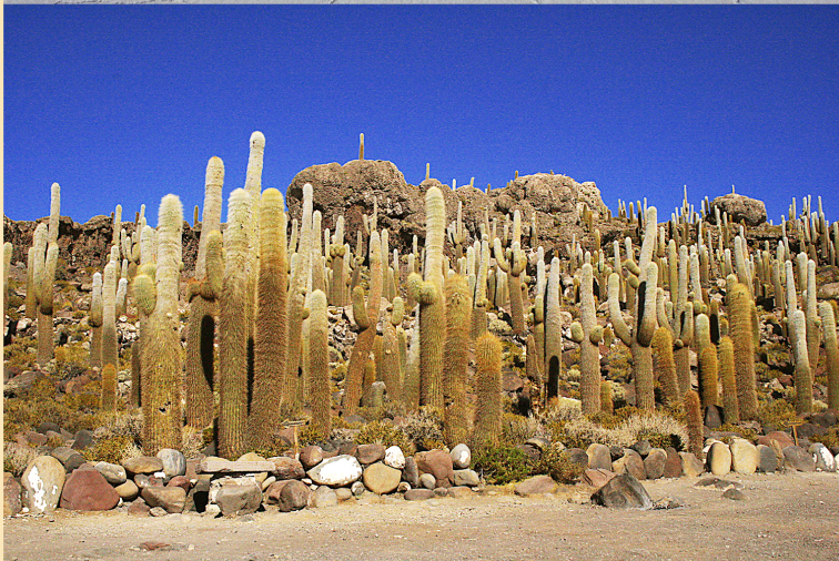
איסלה דל פסקדו